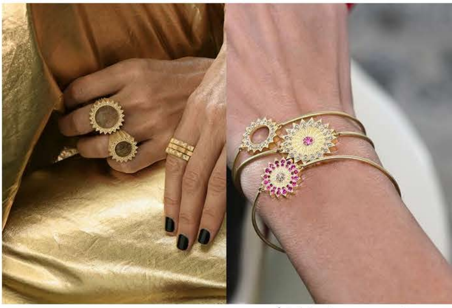
مجوهرات من تصميم ندى غزال تجعل كل امرأة مميزة

تبهزنا ندى غزال دائماً بأجمل قطع المجوهرات، من بينها مجموعة Power of Light المستوحاة من زجاج نوافذ قصر سرسق التري في لبنان، وجمال زهرة اللوتس التي ترمز التجدد والنقاء، هي تناسب مع إطلالة كل سيّدة تهدف لتكون مميزة دائماً، ذلك بسبب أشكالها الرائعة وألوان الاحجار الالفة التي تزيّنها.