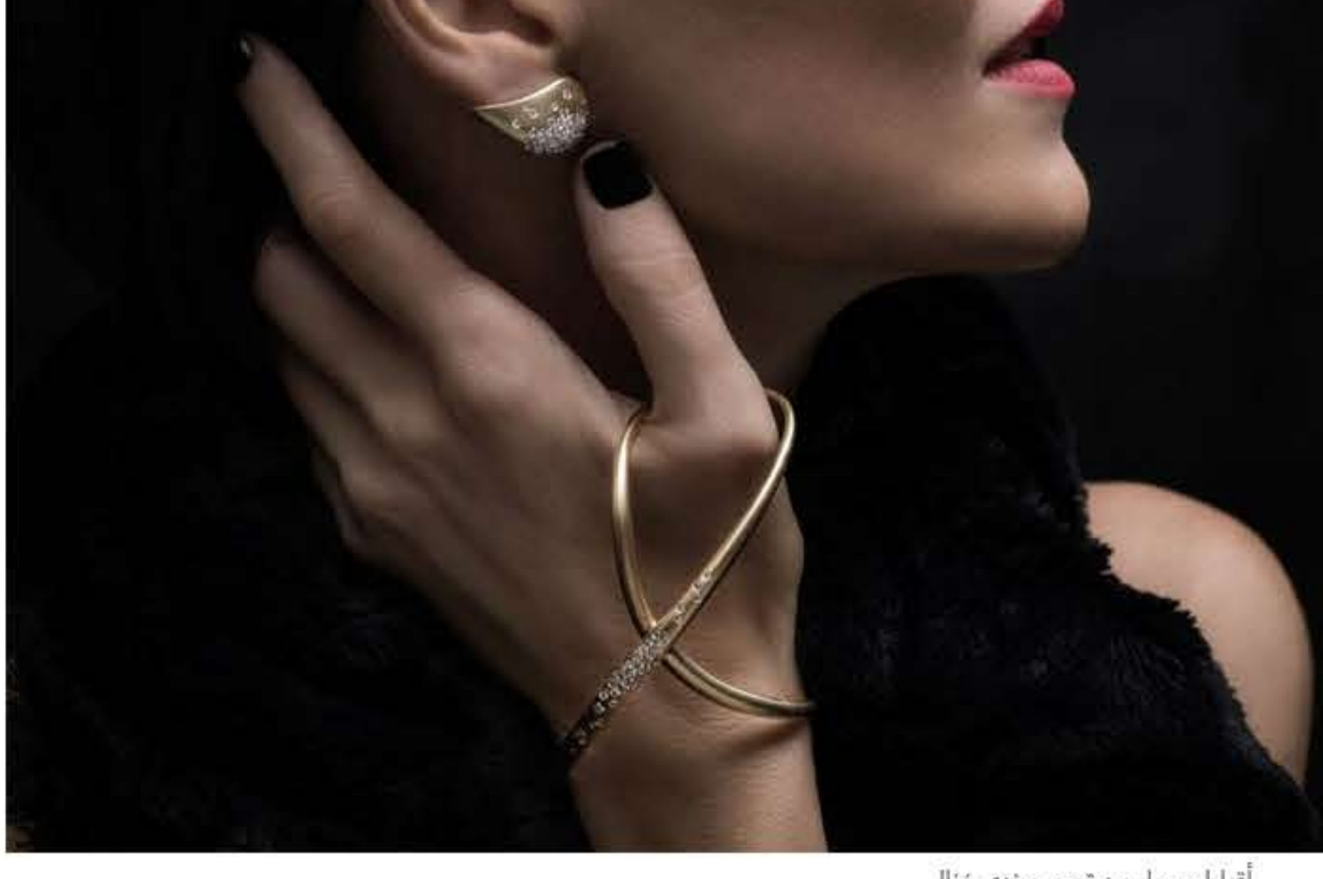
أقراط وسوار من تصميم ندى غزال

اخترنا لك تصاميم مجوهرات وساعات فريدة مثالية لمن تحب الستايل الأثوي الاستثنائي، والتي تتميز بأشكال رائعة مختلفة عما اعتدنا رؤيته، وتعرض بأحجار تمنحك الكثير من التألق، لتستري منها ما يعجبك وتضميها إلى خزانتك المليئة بأجمل قطع المجوهرات.