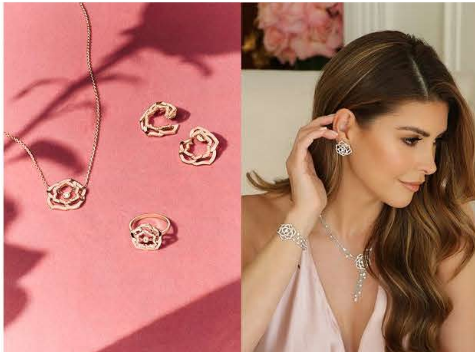
كل امرأة أنيقة تستحق الحصول على هذه المجوهرات

تسلط Piaget الضوء على جمال الزهرة في مجوهرات رائعة ستعجب كل النساء، إذ توحى بجمال تفتح بتلات الأزهار في قطع مذهلة من الذهب الأبيض والوردي المرصعة بالماس، والتي لا تفقد رونقها مهما مرت السنوات، ما يعني أن بإمكان المرأة التألق بها في أي وقت، ومهما كان عمرها.