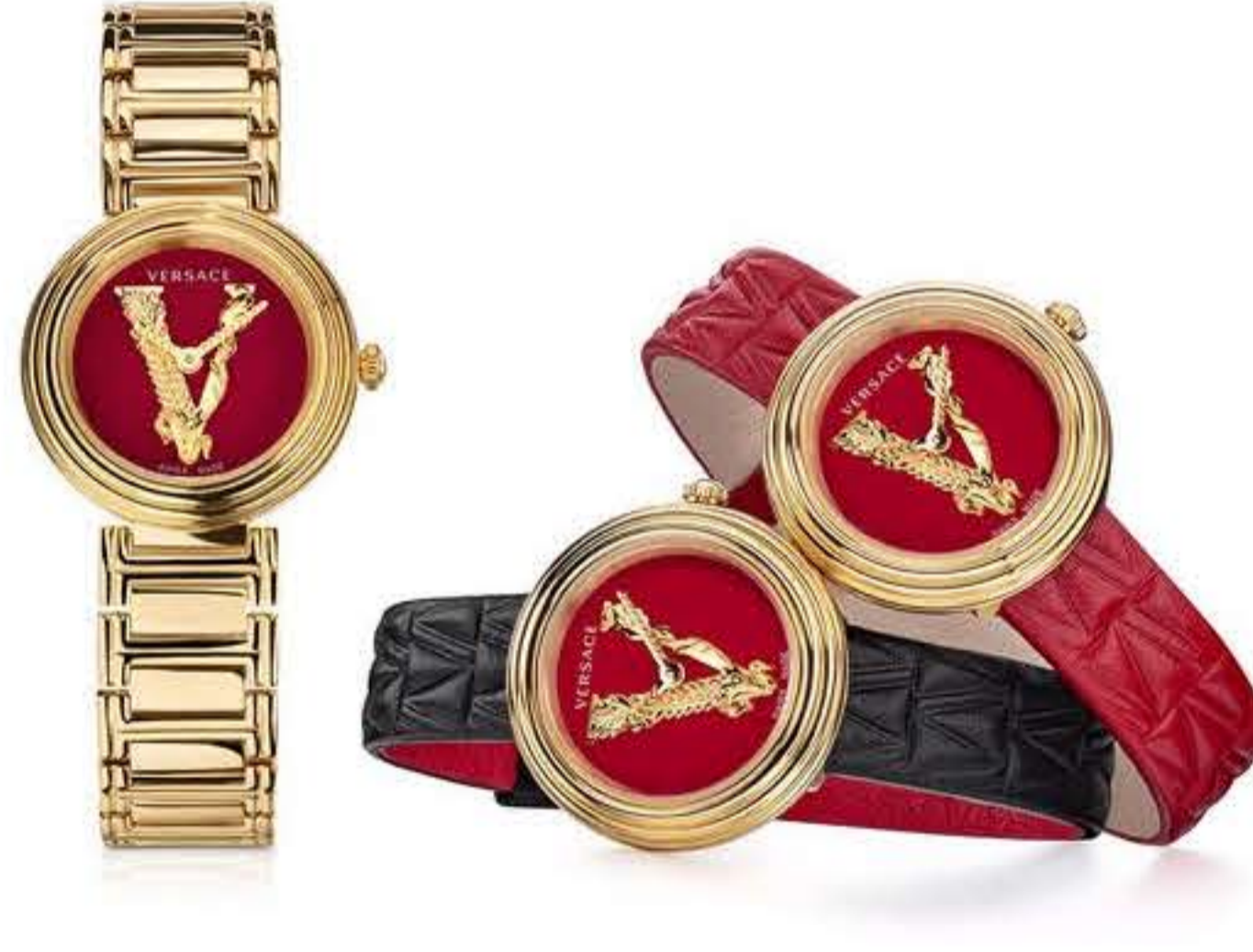
الساعة المثالية لكل من تعشق اللوك الأثوي المميز

تتميز ساعة Mini Virtus Duo من Versace بقصرها الدائري الصغير ذي ميناء أحمر يتوسطه شعار حرف V منقوش، مع سوار قابل للتعديل ليتناسب مع إطلالة المرأة مهما اختلفت. تمنحك هذه الساعة التميز والأناقة، وهي تشكل أيضاً هدية رائعة لمن هي عزيزة على قلبك.